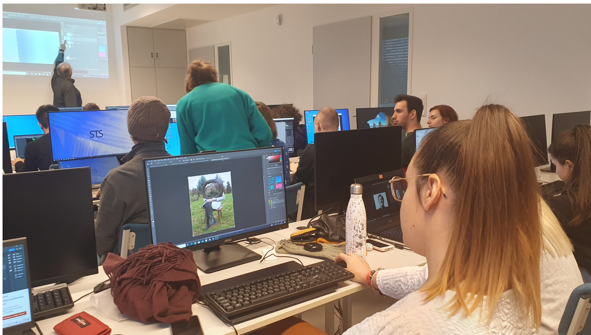
Kollázs feladat - munka az órán