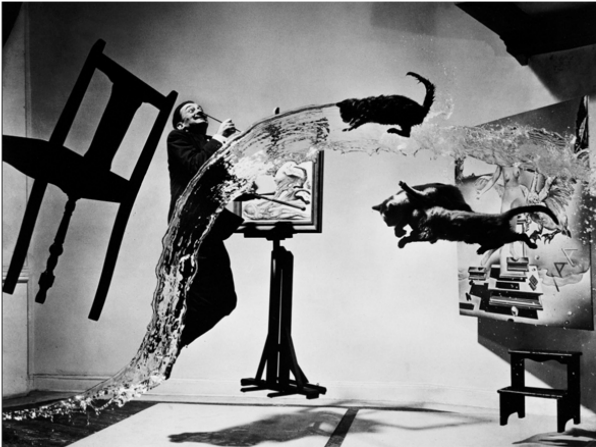
Philippe Halsman: Dali atomicus