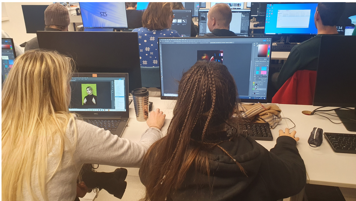
Kollázs feladat - munka az órán

A prezentáció alapján mindenki megpróbálja saját fotók alkalmazásával megoldani a feladatot.