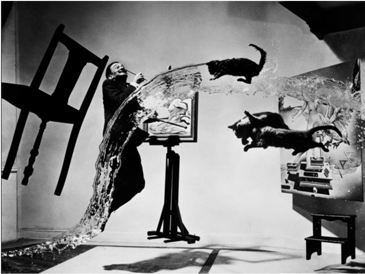
Philippe Halsman: Dali atomicus

https://helpx.adobe.com/photoshop/how-to/composite-photo.html