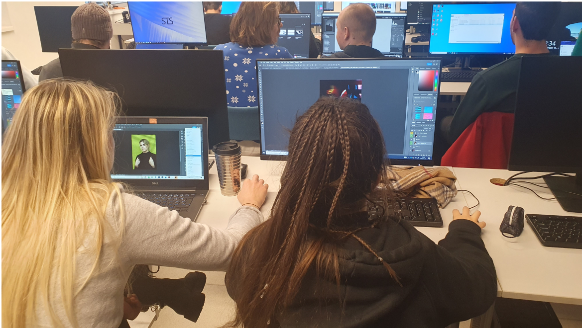
Kollázs feladat - munka az órán

A prezentáció alapján mindenki megpróbálja saját fotók alkalmazásával megoldani a feladatot.