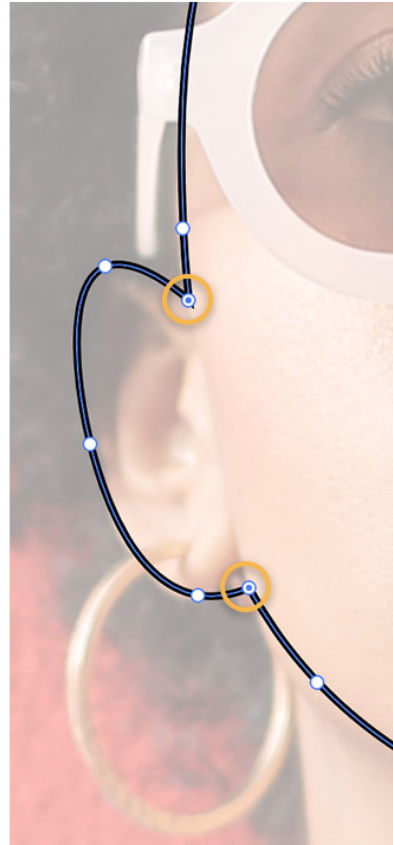
Vektoros portré grafika